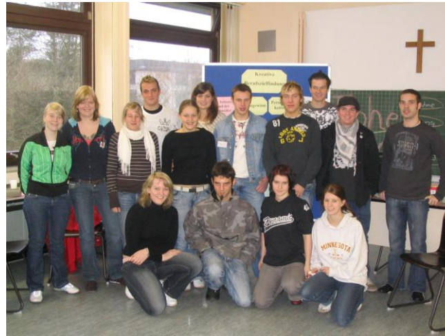
Teilnehmer eines vorhergehenden Workshops